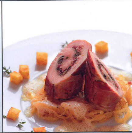
Rezepte ab Seite 82