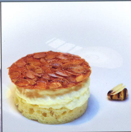
Rezepte ab Seite 28