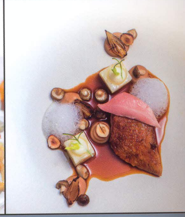
Rezepte ab Seite 90

Deutschland € 8.50 A € 9.50 | CH SFR 9.80